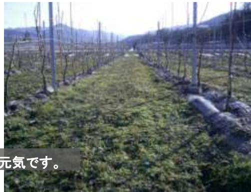
厳しい寒さの中でも青々と元気です。

昨年9月、畝間にケンタッキー・ブルー・グラスの種を蒔きました。しっかり根が張り、雑草が減る効果を期待しています。