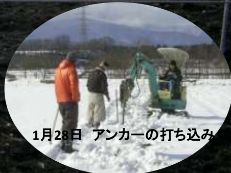
1月28日 アンカーの打ち込み