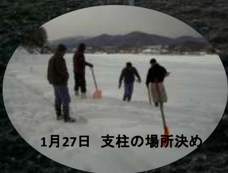
1月27日 支柱の場所決め