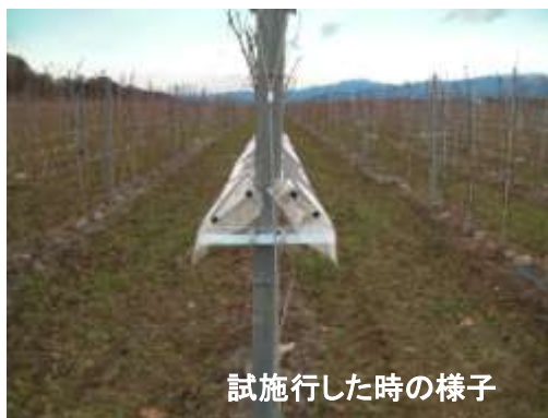
試施行した時の様子

一昨年造成した圃場では、晩腐病、べと病の大きな原因となる、お盆過ぎの雨からぶどうを守るため、レイン・プロテクション(雨除け)の架線の取り付けをしています。